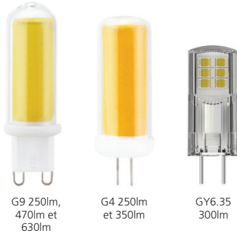
G9 250lm, 470lm et 630lm